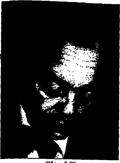
الملك الحسن الثاني